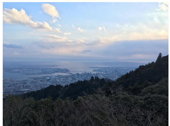
Kuva Koben kaupungin takana kohoavan Maya-vuoren huipulta. Vuorilla käveleminen on japanissa yksi suosituimmista vapaa-ajan harrasteista.

Toiseksi meidän tulee muistaa niitä Kristittyjä sisaria ja veljiä, jotka ovat olleet täällä ennen meitä. Japanissa on tehty lähetystyötä satojen vuosien ajan. 1500-luvulla alkaneen Japanin lähetystyön lupaavan alun jälkeen kristityt kohtasivat 1600-luvulla Japanissa ankaraa vainoa. Heitä otettiin kiinni, heitä kidutettiin ja ristiinnaulittiin. Vainojen loppuhuipennus nähtiin vuonna 1632, jolloin kristinusko kiellettiin Japanissa virallisesti. Vallanpitäjät ottivat kiinni ja teloittivat 55 kristittyä Nagasakissa, johon heille on myöhemmin pystytetty muistomerkki. He kokivat Herransa