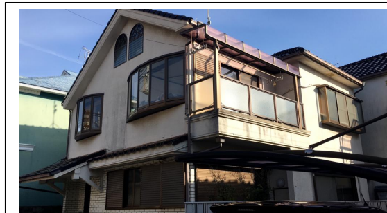
Uusi kotitalomme Kobessa