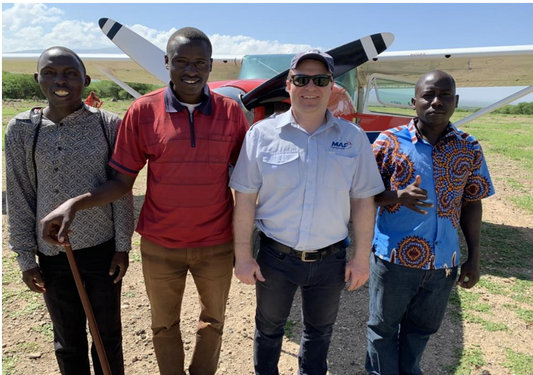
Maasai evankelistat ja iloinen jälleennäkeminen. Pasaka njema-ilosta pääsiäistä!