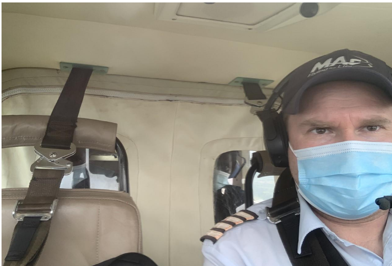
Sairaanhoitajat koneen suojakalvon takana

Palasin Tansaniasta jo viime kuussa ja kaikki viisi paluumatkan aikana ja sen jälkeen tehtyä koronatestiä olivat negatiivisia. Reissu meni hyvin ja kollegat sekä paikalliset yhteistyökumppanit olivat kiitollisia avusta. Olin ainoa lentävä pilotti tuona aikana, koska toinen pilotti oli lomalla ja uusi pilotti ei ole vielä vuoden odottamisen jälkeen saanut työlupaa maahan. Tansanian koronatilanne paheni huomattavasti tämän vuoden alussa, vaikka valtionjohto ei