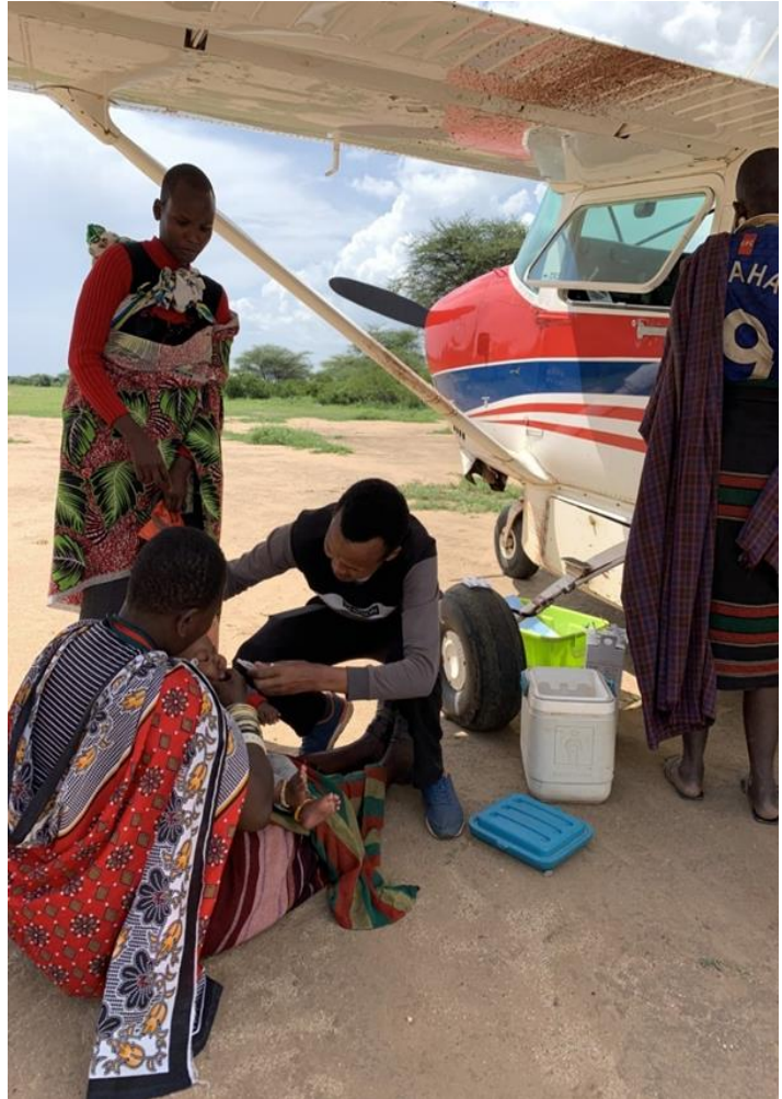
Rokotus siiven alla

Kuten oli tiedossa jo viime vuonna toinen pitkäaikainen pilottikollega perheineen lähtee tänä vuonna Tansaniasta ja apuani varmasti tarvitaan loppukesästä tai alkusyksystä. Toivottavasti siihen mennessä uusi pilotti on saanut työluvan ja voi ainakin lentää helpompia safareita.