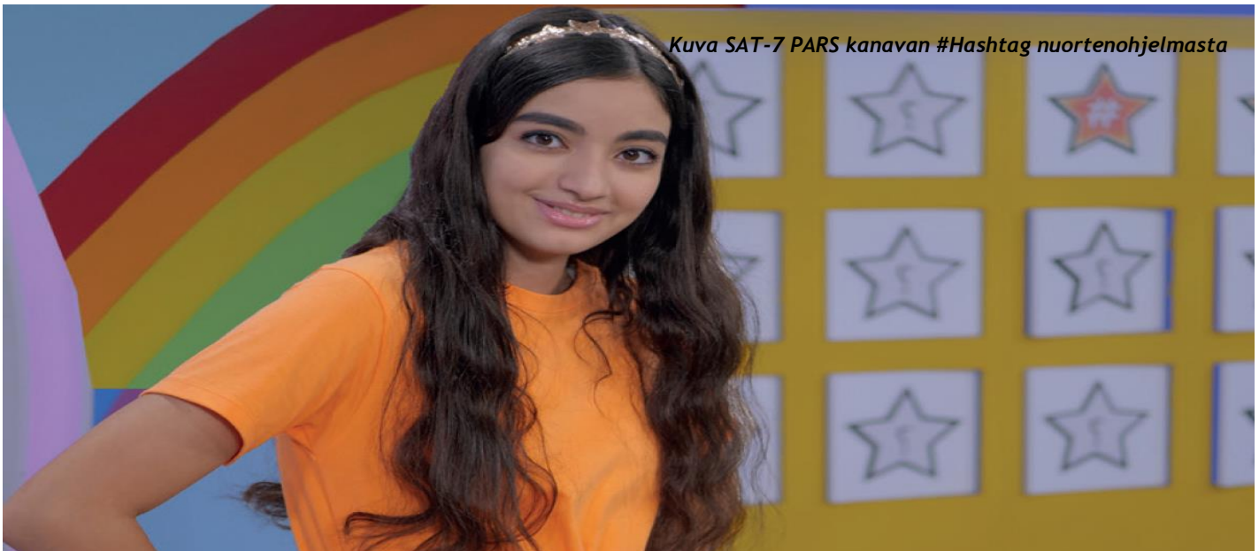
Kuva SAT-7 PARS kanavan #Hashtag nuortenohjelmasta

Yhteistyökumppanimme SAT-7 vietti viime vuonna pandemian varjossa 25-vuotisjuhliiaan. Vuoden 2021 aikana tuotettiin ja lähetettiin satelliittitelevision välityksellä 3,000 tuntia ohjelmaa. Enää SAT-7:stä ei voida puhua pelkästään satelliittiteleviisijärjestönä, sillä ohjelmat tavoittavat katsojia nykyisin monilla eri alustoilla. Satelliittiteleviisio on vain yksi välineistä. Sosiaalinen media on yhä kasvava osa-alue. Uusia ohjelmia tehtäessä pyritään huomioimaan, että yhä suurempi osa katsojista katsoo ohjelmia kännykällään ja siksi mobiilikäytön pitää olla helppoa ja ruutunäkymän miellyttävä silmälle.