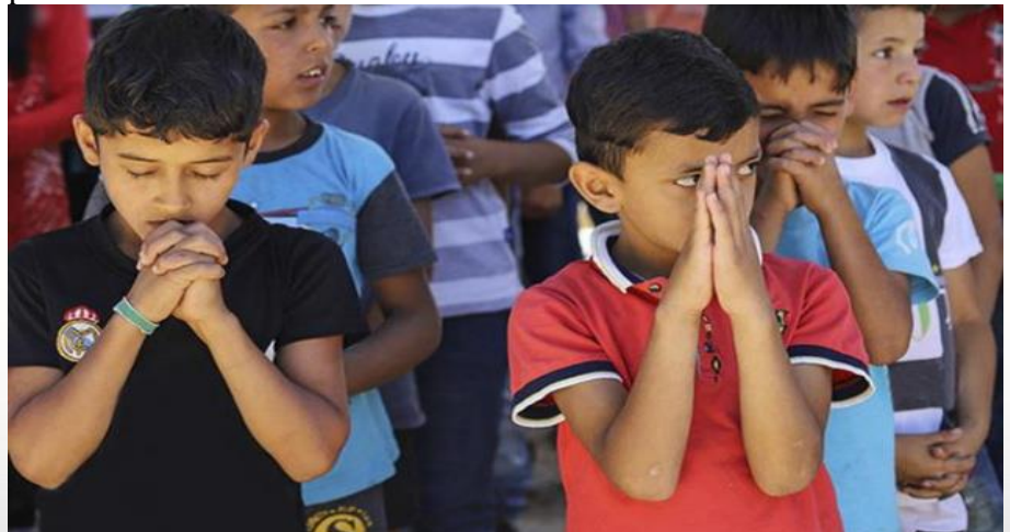
Kuva 1: Lähi-idän lapsia rukoilemassa

Mongolian asioita seuraan yhä entisten kollegoideni kautta, onhan Ulaanbaatar ollut kotikaupunkini vuosien varrella yli viiden vuoden ajan. Ulaanbaatarissa ollaan nyt tiukassa karanteenissa. Pääkaupungissa on todettu reilut kymmenen koronatartuntaa, eikä viruksen haluta leviävän maaseudulle. Muistetaan erityisesti Sansan yhteistyökumppani Perheradio WIND FM:n väkeä ja heidän perheitään.