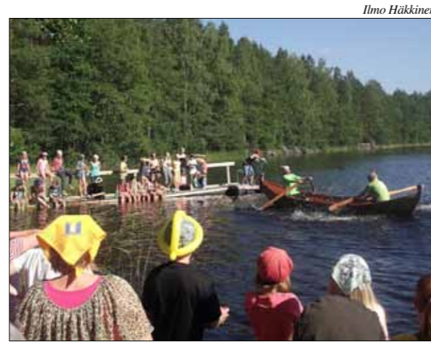
Hippu-leirillä Partaharjussa leirien johtajien soutukilpailu rantajuhlissa. Kuva vuodelta 2013.